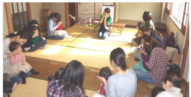
12/10 育児サークルピノッキオ

30分～1時間の出張ひろばですが、実際にサークルに参加された方から「これを機会に支援館に遊びに行ってみようと思う」「家の近くでこのような機会があるとありがたい」という声を頂き、支援館もこの繋がりを大切にしていきたいと感じています。このように地域との連携を図りながら、これからも子どもが健やかに育ち、子育ての喜びが共感できるような支援を目指していきたいと思っています。