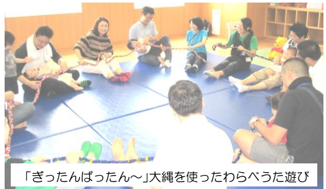
「ぎったんぱったん～」大縄を使ったわらべうた遊び

今回はおおむね1歳のお子さんを対象にしたお父さんと遊ぼうをご紹介します。「おいでおいで～ぱんだ♪」とかわいい手遊びから始まり、最初はちょっと緊張した姿もありましたが、わらべ歌遊びでは親子でたくさんふれ合い、次第に笑顔に。そして、ミニサーキット遊びでは、大きなトンネルに大喜びの子どもたち！トンネルを上手