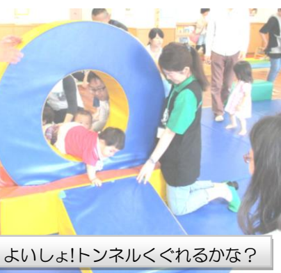
よいしょ!トンネルくぐれるかな?

にくぐるお子さんの姿をお父さんも嬉しそうに見守ります。平均台をお父さんと手をつなぎながら渡ったり、ボールを投げて箱の中に入れたいり…中にはボールコーナーが気に入り、ずっとボール遊びを楽しむ子もいました。お父さんたちは、「こんなことができるようになったんだ」「こんな遊びが好きなんだなあ」と子どもの成長を発見するいい機会になったようです。「ぞうさんのぼうし」